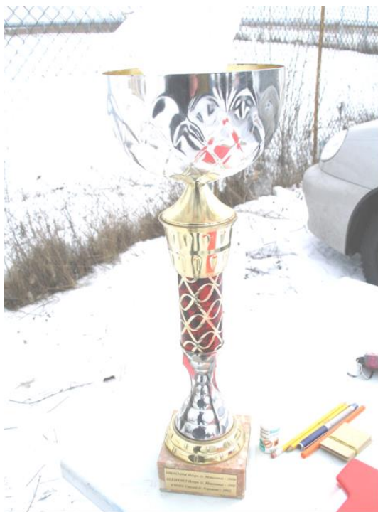
ШЛЯХАМИ РЕВОЛЮЦІЇ ГІДНОСТІ