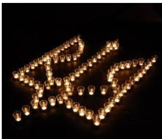
КУБОК ПАМ'ЯТІ ГЕРОЇВ НЕБЕСНОЇ СОТНІ